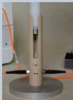
☆ピペットのまま直接測定