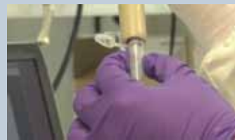
☆測定終了後に、チップ内のサンプルを完全に回収可能

VersaTip (2.5 \mu L、ピペットチップ型のセル) を利用することで、チップ内にサンプルを保持したまま測定することができます。測定終了後は、貴重なサンプルを全量回収することが可能です。