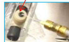
プラチナ電極スプレー(別売)