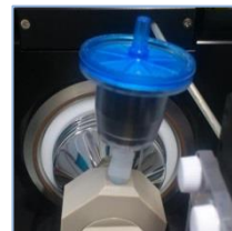
エアフィルター(チャコールフィルター) 専用イオンランスファーチューブ (MS本体に取り付け)